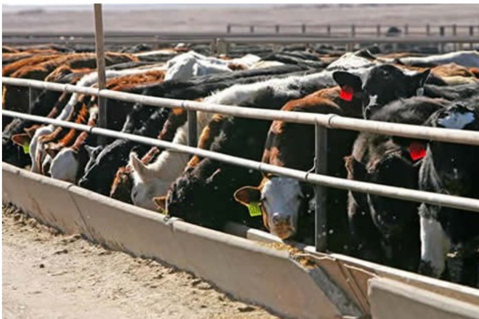
[Llun: Ffermydd bwydo (porthiant)]