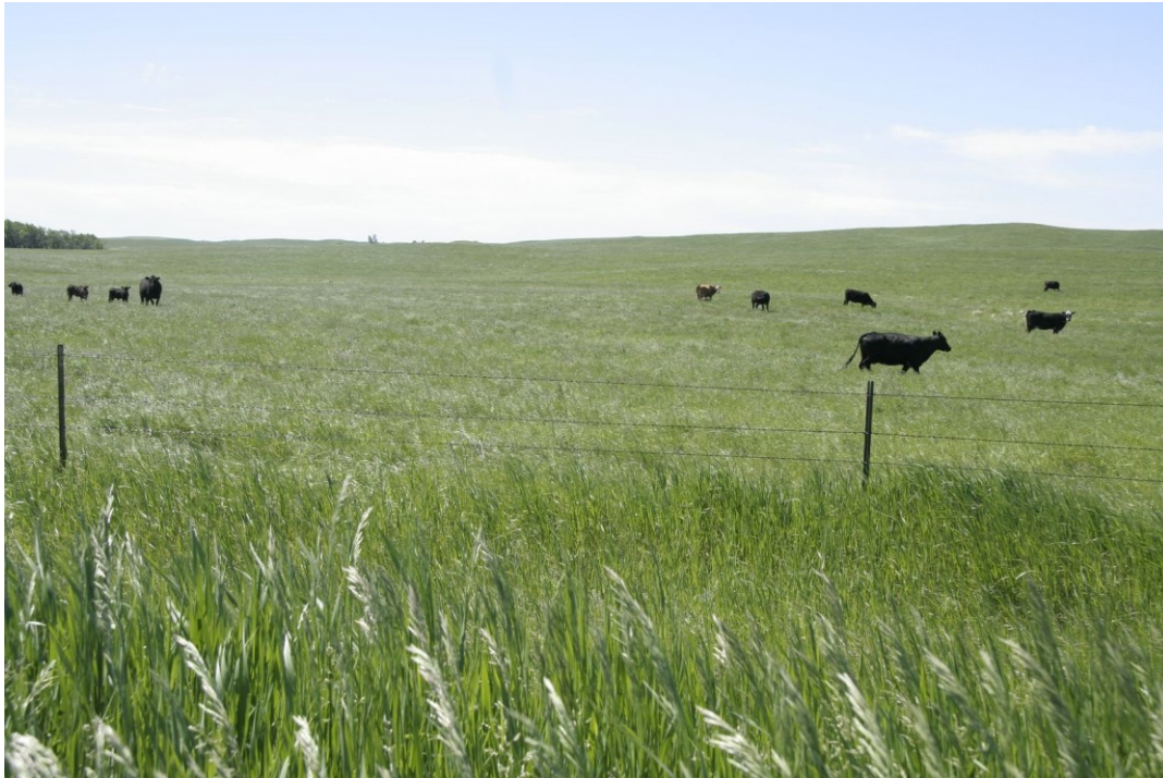
[Llun: Gwartheg ar y paith]